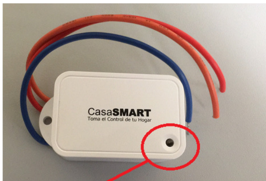
Botón y Led Indicador